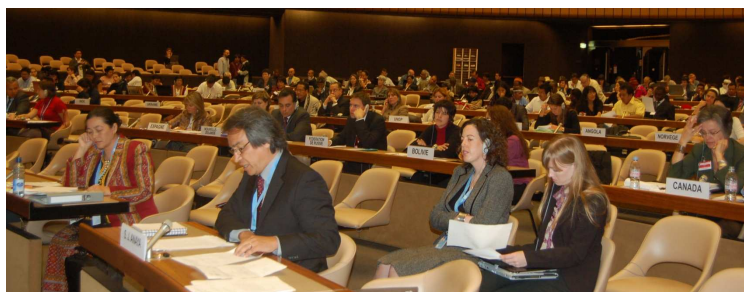
Специальный докладчик профессор Джеймс Анайя на заседании Экспертного механизма по правам коренных народов