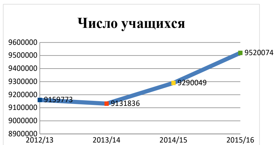
Диаграмма 1: Число учащихся, участвующих в программе

24. В 1994 году правительство приняло Национальную программу школьного питания (НПШП), которая направлена на борьбу с голодом и содействие обучению в школах путем предоставления учащимся качественной питательной пищи. НПШП полностью финансируется государством через специальную статью бюджета. Во исполнение рекомендаций, вынесенных по итогам проведенного Бюджетно-финансовым комитетом в 2006 году обследования, эта программа была расширена, с тем чтобы охватить как начальные, так и средние школы. На диаграмме 1 ниже представлен общий охват программы за четыре (4) года; т.е. за 2012/13 и 2015/16 финансовые годы программой было охвачено 9,5 млн. учащихся.